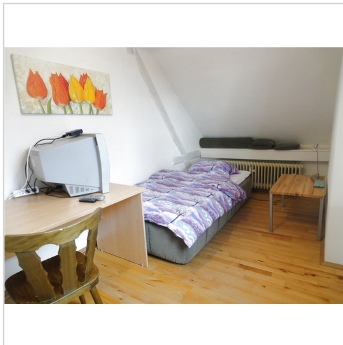
App. re. hinteres Zimmer

Eine Waschmaschinen + Trocknernutzung ist nach Absprache möglich