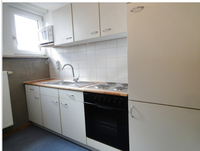
Küche mit Ausstattung

Wohnart: Wohnung Pauschalmiete: 69,00 EUR pro: Tag Bezugsfrei ab: 01.01.2012