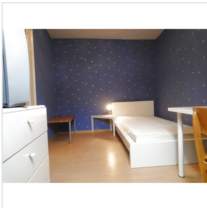
App. geradeaus 1 er Zimmer